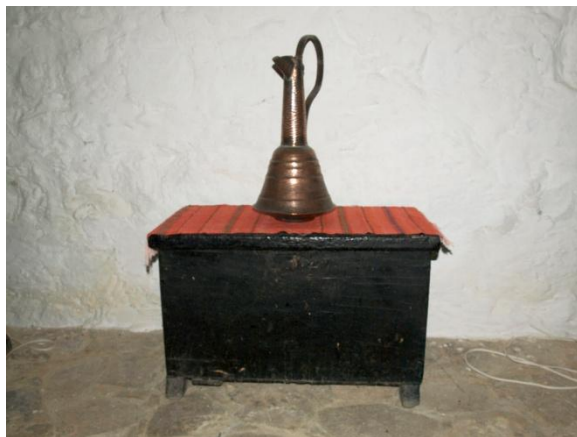
Εικ. 14 Κασέττα (μικρού μεγέθους κασέλα) βαμμένη με μαύρο χρώμα, χωρίς σκαλισματα. ιδιοκτ. : Ειρήνη Λιμνάτη Λιμνάτης - Λεμεσός

Τα ξυλόγλυπτα της Ακανθούς, όπως και εκείνα της Λαπήθου (για την άψογη τεχνική τους) κατέχουν μια σημαντική θέση στην κυπριακή και κατ' επέκταση στην ελλαδική ξυλογλυπτική. (Παπαδημητρίου, σελ. 49)