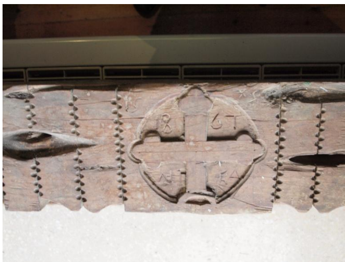
Εικ. 16 Κομμάτι από κασέλα με κύριο χαρακτηριστικό τον Σταυρό. (1867) Μουσείο Λαϊκής Τέχνης - Λευκωσία

Ο Σταυρός: το πιο σημαντικό σύμβολο του Χριστιανισμού που παρουσιάζεται, όχι μόνο πάνω σε μπαούλα, αλλά και σε εισόδους σπιτιών κ.α. Συμβολίζει το πάθος για τον Χριστό και πιστεύεται ότι διώχνει το κακό μακριά. Επίσης, φέρνει την ευλογία του θεού, στους ανθρώπους. Ο Σταυρός συνήθως τοποθετείται στο κέντρο (βλ. Εικ. 16)