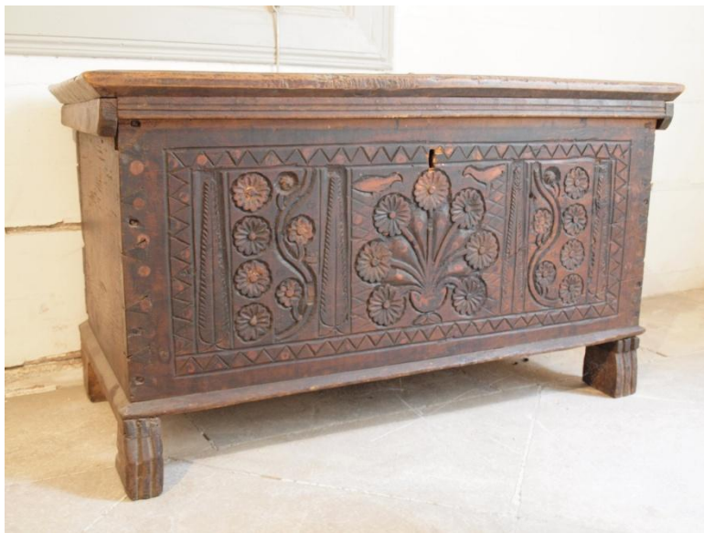
Εικ. 17 Κασέλα μικρού μεγέθους με λεπτομερή διακόσμηση από μαργαρίτες, ρόδακες και κυπαρίσσια ανάμεσα τους. Πλαισιώνεται με ζικ - ζακ μοτίβο και έχει ψηλά πόδια που θυμίζουν πόδια λιονταριού. Μουσείο Λαϊκής Τέχνης – Λευκωσία

Οι κύκλοι που συνδέονται μεταξύ τους: Σε μερικά μπαούλα συμβολίζουν τα τρία ιδανικά της ζωής, σχηματίζοντας ένα τρίγωνο.