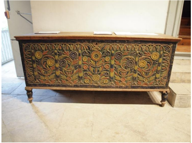
Εικ. 13 Κασέλα βαμμένη σε έντονα χρώματα με καθαρά περιγράμματα στο σκάλισμα της. Μοτίβα από καμπύλες γραμμές και ποικίλα μεγέθη από μαργαρίτες. Μουσείο Λαϊκής Τέχνης - Λευκωσία

Στο κεφαλοχώρι της Ακανθούς αναπτύχθηκε ένας ιδιότυπος συνδυασμός ξυλογλυπτικής και χρωματιστής διακόσμησης σε κασέλες (βλ. Εικ. 13), ερμαράκια του τοίχου, τοιχάρμαρα, ράφια, σουβάντζες και , σπανιότερα, καρέκλες. Η τέχνη αυτή, που βρισκόταν στην ωριμότητα της γύρω στα μέσα του 19 ου αιώνα, σύμφωνα με τις πληροφορίες των ντόπιων, είχε επίδραση από Ελαδίτη ξυλογλύπτη που εγκαταστάθηκε στην περιοχή. Το σχέδιο είναι ανάγλυφο, πιο χαμηλό από εκείνο των ξυλογλύπτων της Λαπήθου. Τα φυτικά και συμβολικά θέματα πλαισιώνονται από αγγέλους, μυθικά πουλιά και ζώα, δεσμευμένα λιοντάρια, γοργόνες, σκηνές κυνηγιού με γεράκια και σκύλους, που αποδίδονται με αδρά και καθαρά περιγράμματα. Το φόντο μένει στο φυσικό χρώμα του ξύλου και, σε μερικές περιπτώσεις, έχει μικρή επαναλαμβανόμενη χαρακτή διακόσμηση. Τα ανάγλυφα σχέδια χρωματίζονται με λαδομπογιά σε κόκκινο, κίτρινο, πορτοκαλί, πράσινο, θαλασσί χρώμα. Τα ιδιότυπα θέματα αποδίδονται στο ξύλο με αφέλεια, δυνατή γραμμή και χρώματα λαμπερά.