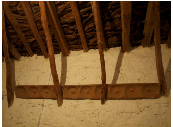
Εικ. 5 Βουμποσάνιδο με δέκα κοιλότητες, όπου τοποθετούσαν τα ψωμιά

Το τραπέζι, η τάβλα, ήταν στενόμακρο με τέσσερα πόδια και συρτάρι, όπου οι ξυλουργοί χάρασαν απλά γεωμετρικά σχέδια. Σε μερικές περιπτώσεις, ωστόσο, οι τεχνίτες σκάλιζαν ανάγλυφα φυτικά μοτίβα.