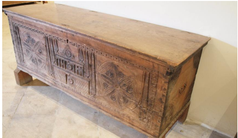
Εικ. 19 Κασέλα με λεπτομέριες στο σκάλισμά της, σε φυσικό χρώμα ξύλου. Παρουσιάζεται κεντρικό θέμα το παλάτι με νατουραλιστικά συμμετρικά σύμβολα γύρω του. Θυμίζει αρκετά αρχιτεκτονικά μοτίβα. Μουσείο Λαϊκής Τέχνης - Λευκωσία

Το αστέρι του Δαβίδ: Ακόμη ένα εβραϊκό σύμβολο που βρέθηκε σε διαφορετικά μασούλα. Η χρήση τέτοιων συμβόλων που διαφέρουν από τον Κυπριακό πολιτισμό, μπορεί να αποδίδεται από ξένους κατακτητές που πέρασαν από το νησί. (Μανρομμάντις, σελ. 106)