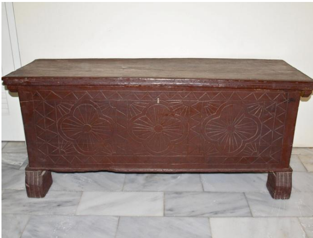
Εικ. 7 Κασέλα μεσαίου μεγέθους, σκαλισμένη με σύμβολα από σχηματοποιημένους ρόδακες και πλαίσιο ζικ - ζακ γραμμών. Τα μπροστινά πόδια έχουν σχήμα ποδιών λιονταριού, ένας απλός και συνηθισμένος τύπος κασέλας που επικράτησε κατά τον 19ο και 20ο αιώνα.

Το κυριότερο έπιπλο του αγροτικού σπιτιού κάθε νέου ζευγαριού ήταν η κασέλα, το σεντούτζι, όπου φυλάγονταν τα προικιά της νύφης (βλ. Εικ. 7). Το «σεντούκι» (κασέλα) είχε μήκος περίπου 190 εκ. πλάτος 50 εκ. και ύψος 50 εκ. Στηριζόταν σε τέσσερα πόδια που στην αρχή είχαν μορφή ποδιού λιονταριού και μετά πήραν πιο απλή μορφή. (Κάνθος, σελ.69) Η