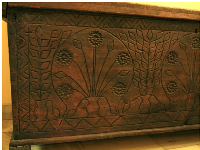
Εικ. 11 Πρόσοψη κασέλας σκαλισμένη με γλάστρες από λουλούδια και πλαίσιο από ζικ - ζακ μοτίβο.

Ολόκληρη η παραλληλόγραμμη σύνθεση πλαισιώνεται γύρω – γύρω με στενή ταινία από κλαδί αμπέλου ή γεωμετρικό μοτίβο (βλ. Εικ. 11). Παρόλο, ότι τα μοτίβα είναι παρόμοια, υπάρχει μια μεγάλη ποικιλία στη σύνθεση και στις παραλλαγές τους. Στην περιοχή Λαπήθου και Καραβά υπήρχαν πολλές κασέλες της τεχνοτροπίας αυτής σε διάφορα μεγέθη, μεγάλες για το ρουχισμό και μικρότερες για τα πολύτιμα σκεύη του σπιτιού. Η κασέλα ήταν ένα από τα πιο σημαντικά είδη της προίκας κάθε κοπέλας, μαζί με το ρουχισμό του σπιτιού. Επισημαίνεται ότι, μέχρι τις αρχές του 20 ου αιώνα, ο γαμπρός έκτιζε το σπίτι, ενώ η νύφη ετοίμαζε την κινητή προίκα (τα έπιπλα και τα υφαντά του αργαλειού της).