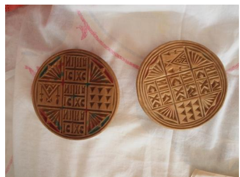
Εικ. 2 Ξύλινα καλούπια για τύπωμα σε ψωμιά. Σύμβολα από τη θρησκεία που σημαίνουν «Ιησούς Χριστός Νικά» Λιμνάτης - Λεμεσός

Τα αγροτικά ξυλόγλυπτα έχουν μια ναϊβ έκφραση δημιουργίας. Στοιχεία όπως η αφέλεια, έλλειψη αναλογιών, γνήσια αισθαντικότητα χωρίς κανόνες, με έμφυτη τη γνώση σχεδίου, πηγαίος ερεθισμός δημιουργίας, χωρίς επιδράσεις τεχνοτροπιών. (βλ. Εικ. 3) Ακόμα και στην περίπτωση που ο