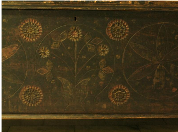
Εικ. 8 Πρόσοψη κασέλας με συμμετρικά σχέδια. Ρόδακες και κύκλοι, σκαλισμένα με χαμηλό ανάγλυφο, ενώ οι μαργαρίτες έγιναν με βαθύτερη χάραξη.

Οι ξυλουργοί έσχίζαν τους ξηρούς κορμούς σε σανίδες με μεγάλα πριόνια, τους καταρράκτες. Με αυτές κατασκεύαζαν το κάθε τμήμα της κασέλας ξεχωριστά. Την πρόσοψη, το πρόσωπο, τα δύο πλαϊνά, το πίσω μέρος, το σκέπασμα και τα τέσσερα πόδια. Στη πρόσοψη σκάλιζαν τη διακόσμηση, που την κάλυπτε ολόκληρη, αφού πρώτα σχεδίαζαν με μολύβι ή κάρβουνο. Το ανάγλυφο είναι χαμηλό σκαλισμένο με μεγάλη δεξιοτεχνία (βλ. Εικ. 8). Είναι φανερό