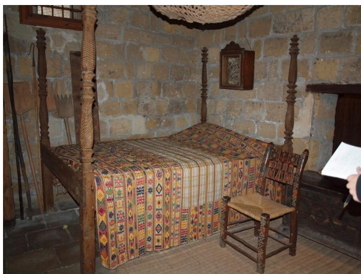
Εικ. 6 Ξύλινο κρεβάτι με τέσσερις στύλους διακοσμημένους με χαρακτά μοτίβα και καρέκλα του τόννου με θρησκευτικά και διακοσμητικά σύμβολα βαμμένα σε έντονα χρώματα. 19ος αιώνας.

Ιδιοκτ. : Ειρήνης Λιμνάτη Λιμνάτης – Λεμεσός