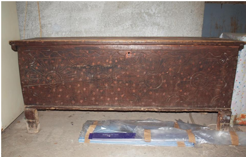
Εικ. 3 Κασέλα μεγάλου μεγέθους, σκαλισμένη με σχηματοποιημένους ρόδακες και πλαίσιο από ζικ - ζακ καμπυλόμορφη γραμμή.

λαϊκός σκαλιστής – τεχνίτης έχει κάποιο πρότυπο, είναι αδύνατο να μορφοποιήσει τον οπτικό ερεθισμό ρεαλιστικά. (Φαρμακάς, σελ. 119)