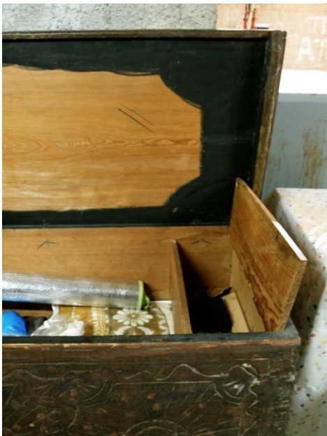
Εικ. 12 Εσωτερικό κασέλας χωρισμένο σε δύο μέρη. Στο μεγάλο μέρος φυλάγονταν ο ρουχισμός, ενώ στο μικρό, το παρασέντουκο, γινόταν η φύλαξη πολύτιμων αντικειμένων. ιδιοκτ. : Κόστα Κουζάλη Αγιοί Τριμυθιάς – Λευκωσία

Οι σανίδες της κασέλας συναρμολογούνται με διπλά καρφιά, διπλόριζα, καμωμένα από τους ντόπιους σιδηρουργούς. Το σκέπασμα, καππάτζι, με τον τρόπο αυτό ανοιγοκλείνει. Το διακοσμημένο πρόσωπο έχει οδοντωτά τελειώματα, που εφαρμόζουν στα υπόλοιπα τμήματα της κασέλας και κολλούν με κόλλα, πετσόκολλα (δημιουργόταν από δέρμα ζώων και ήταν αρκετά ανθεκτική).