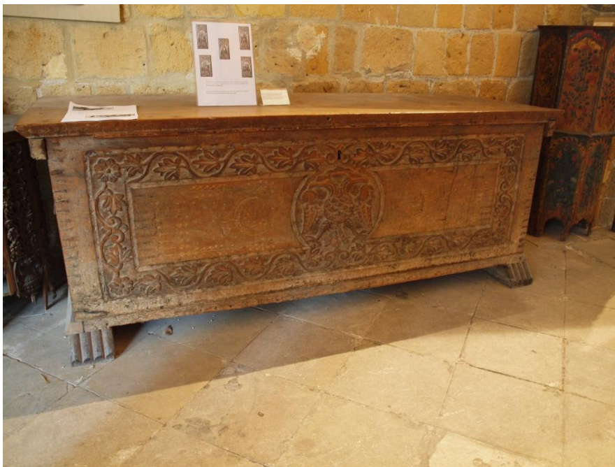
Εικ. 15 Κασέλα σε φυσικό χρώμα ξύλου με πλαίσιο από ανάγλυφα κλαδιά άμπελου και στο κέντρο το δικέφαλο αετό. Τέτοιου είδους κασέλες τοποθετούνταν κυρίως στις εκκλησίες.

Είναι γνωστό ότι τα αστικά ξυλόγλυπτα δανείζονται ευκολότερα ξένα στοιχεία από άλλες περιοχές. Με την ίδια ευκολία προσαρμόζονται στην εκάστοτε «μόδα». (Παπαδημητρίου, σελ. 99)