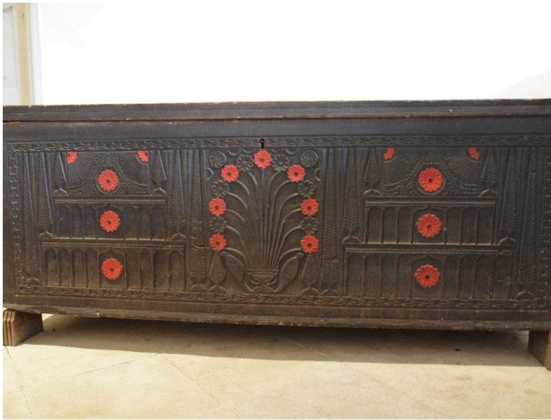
Εικ. 10 Κασέλα με ένα πρωτότυπο στυλ διακόσμησης. Λεπτομερή σκαλίσματα παλατιών με κυπαρίσσια να τα πλαισιώνουν και έντονες κόκκινες μαργαρίτες στο κέντρο.

Κεντρικό μοτίβο της διακόσμησης είναι, συνήθως, το παλάτι, η εκκλησία, ο ήλιος, οι ρόδακες (δηλαδή τα σχηματοποιημένα ρόδα - τριαντάφυλλα), τα αντιμέτωπα ζώα ή πουλιά, η γλάστρα με λουλούδια (βλ. Εικ. 10). Πλαισιώνεται με συμμετρικά διαχωρίσματα, που ορίζονται από κυπαρίσσια ή κατακόρυφες στήλες με ρόδακες ή γεωμετρικά σχήματα, μέσα στα οποία βρίσκονται ποικίλοι ρόδακες, γλάστρες, φυτά. (Παπαδημητρίου, σελ. 32)