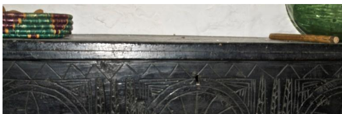
Εικ. 18 Πρόσωση κασέλας με γεωμετρικά μοτίβα όπως η ζικ-ζακ γραμμές και οι κύκλοι. Συνδιάζει νατουραλιστικά σύμβολα κυπαρισσιών και σχηματοποιημένους ρόδακες. ιδιοκτ.: Σκεύης Λιμνάτης - Λεμεσός

Οι ζικ – ζακ γραμμές : Συμβολίζουν τα σκαμπανεβάσματα της ζωής. Οι συνεχόμενη σκαλιστή γραμμή, αντιπροσωπεύει το άπειρο και το άγνωστο. Τέτοιες γραμμές χρησιμοποιούνται σαν περιγράμματα των σχεδίων στο μπροστινό μέρος του μπαούλου (βλ. Εικ. 18).