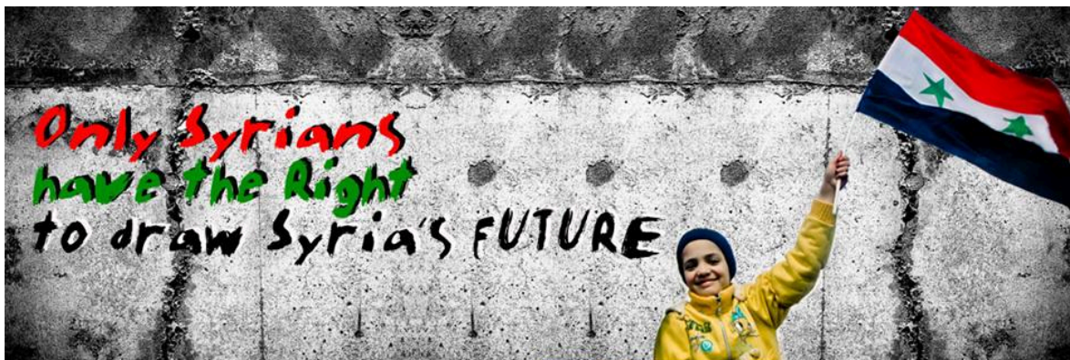
Εικόνα 4. «Δύσκολες στιγμές στη Συρία εξαιτίας του εμφύλιου πολέμου»

Η εικόνα θέλει να τονίσει το θάρρος και την προσπάθεια των Σύριων πολιτών για τερματισμό του εμφύλιου πολέμου.