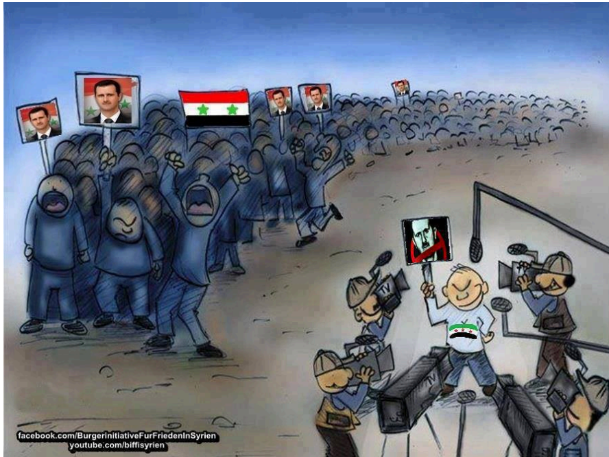
Εικόνα 4. «Τα ΜΜΕ και οι πολιτικοί αποπροσανατολίζουν τον κόσμο»

Τα κυρίαρχα ΜΜΕ φαίνεται να είναι «εχθρός» της Συρίας, αφού φαίνεται να παρουσιάζουν τα γεγονότα εντελώς διαφορετικά από ότι είναι στην πραγματικότητα.