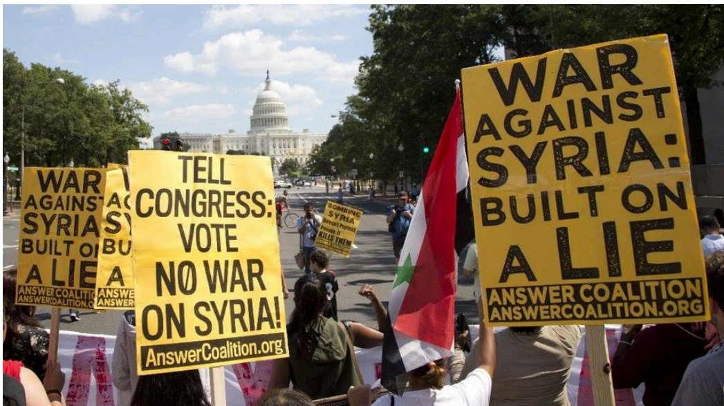
Διαδηλώσεις πολιτών-ακτιβιστών έξω από το Λευκό Οίκο για τον πόλεμο στη Συρία.