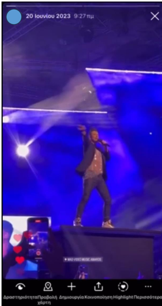
Εικόνα 8: Screenshot από Scroll Back Technique Video

Στο πιο πάνω στιγμιότυπο παρουσιάζεται η εμφάνιση του Σάκη Ρουβά στα MAD MUSIC AWARDS όπου πραγματοποιήθηκε στις 20 Ιουνίου 2023. Το βίντεο έχει καλό ήχο, ο φωτισμός είναι ρυθμισμένος με την φωτογραφική του κινητού έτσι ώστε να φαίνεται καθαρά ο τραγουδιστής και να μην υπάρχουν οποιεσδήποτε “κακές” παρεμβολές στο βίντεο. Έχει πραγματοποιήσει zoom για να μπορέσει να φαίνεται καλά ο τραγουδιστής. Μπορεί να γίνει αντιληπτή η χρήση κινητών και από άλλα άτομα πιο μπροστά. Όσον αφορά τις δυνατότητες εντός της εφαρμογής και της ιστορίας (Story) στα αριστερά φαίνεται πως στην ιστορία (story) αντέδρασαν κάνοντας like ακόλουθοι