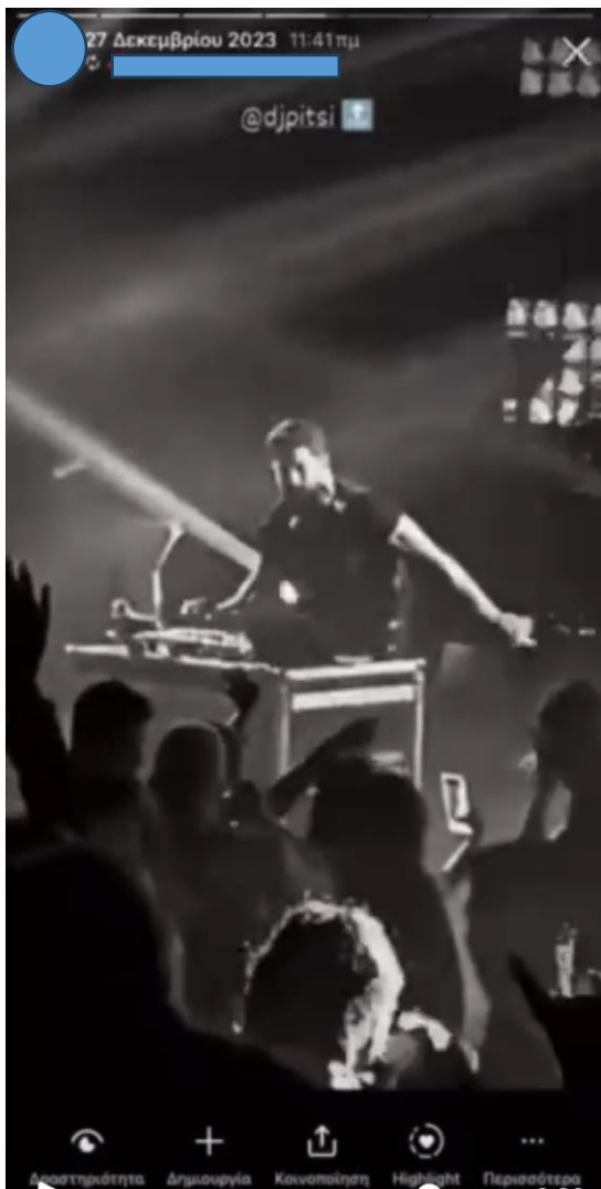
Εικόνα 12: Screenshot από Scroll Back Technique Video

τελευταίο κομμάτι. Έτσι μετά που κατέγραψε του υλικό το ανέβασε το βίντεο αυτό στον λογαριασμό του στο Instagram. Αριστερά παρατηρείται η αλληλεπίδραση με τους ακόλουθούς του καθώς φαίνεται ότι πραγματοποίησαν like στην συγκεκριμένη ιστορία (Story). Έχει προσθέσει στο κάτω μέρος της ιστορίας (Story) την τοποθεσία στην οποία βρισκόταν. Ο ίδιος δήλωσε κατά την διάρκεια του walkthrough ότι το πρόβλημα το οποίο αντιμετώπισε κατά την διάρκεια της λήψης ήταν με το χρώμα και την εστίαση. Ο λόγος που υπήρχε αυτό το πρόβλημα ήταν τα φώτα της σκηνής τα οποία δεν προσαρμόζονταν με το πλάνο και την φωτογραφική του κινητού του χρήστη.