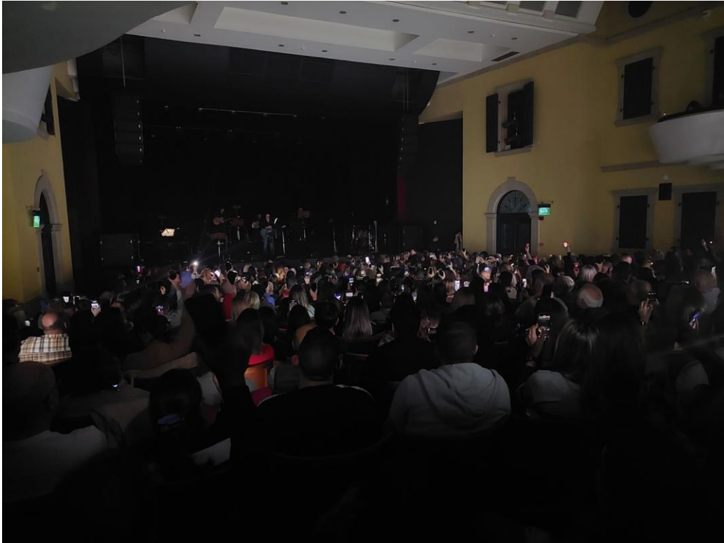
Εικόνα 7: Χρήση κινητών τηλεφώνων με την λειτουργία “Flash” μετά από αίτημα της παραγωγής και του τραγουδιστή

Στην ίδια συναυλία ταυτόχρονα με το περιστατικό μεταξύ της παραγωγής-θεάτρου υπήρχε ένα άλλο περιστατικό μεταξύ δύο θεατριών. Προσωπικό του θεάτρου μετά από κουβέντα που είχε με εμένα μου ανέφερε πως ο ίδιος σε σχέση με την χρήση κινητού πάντα κρατάει αυστηρή στάση είτε αφορά καταγραφή είτε αφορά σερφάρισμα είτε μηνύματα κτλ. Ο ίδιος έδειχνε πολύ απογοητευμένος με αυτή την κατάσταση αλλά δεν μπορούσε να κάνει περισσότερα καθώς η διαταγή προήλθε από την ίδια την παραγωγή. Κατά την διάρκεια της συζήτησης μου με το συγκεκριμένο άτομο του προσωπικού βγήκε μια κυρία για να μιλήσει στο τηλέφωνο καθώς προηγουμένως της είχε γίνει παρατήρηση από την κυρία που καθόταν στο πίσω κάθισμα ότι την ενοχλεί η συνεχής χρήση κινητού με υψηλή φωτεινότητα με σκοπό την αποστολή μηνύματος. Η κοπέλα είχε νιώσει αρκετά άσχημα που ένα άτομο της είχε κάνει παρατήρηση και γι αυτό τον λόγο βγήκε έξω από το θέατρο. Επίσης, ως δικαιολογία για την χρήση κινητού ανέφερε το πως είχε άρρωστο παιδί στο σπίτι και δεν μπορούσε να μην απαντάει στα μηνύματα. Το προσωπικό του θεάτρου που ήταν υπεύθυνο της παράστασης εκείνη την ημέρα ανέφερε χαρακτηριστικά “ Τι ενόμισαν; Είμαστε μπουζούκια τζαι κάμνουν ό,τι θέλουν; ” θεωρεί αρκετά σημαντικό και ευγενικό εκ μέρους του ίδιου του θεάτρου αλλά και του