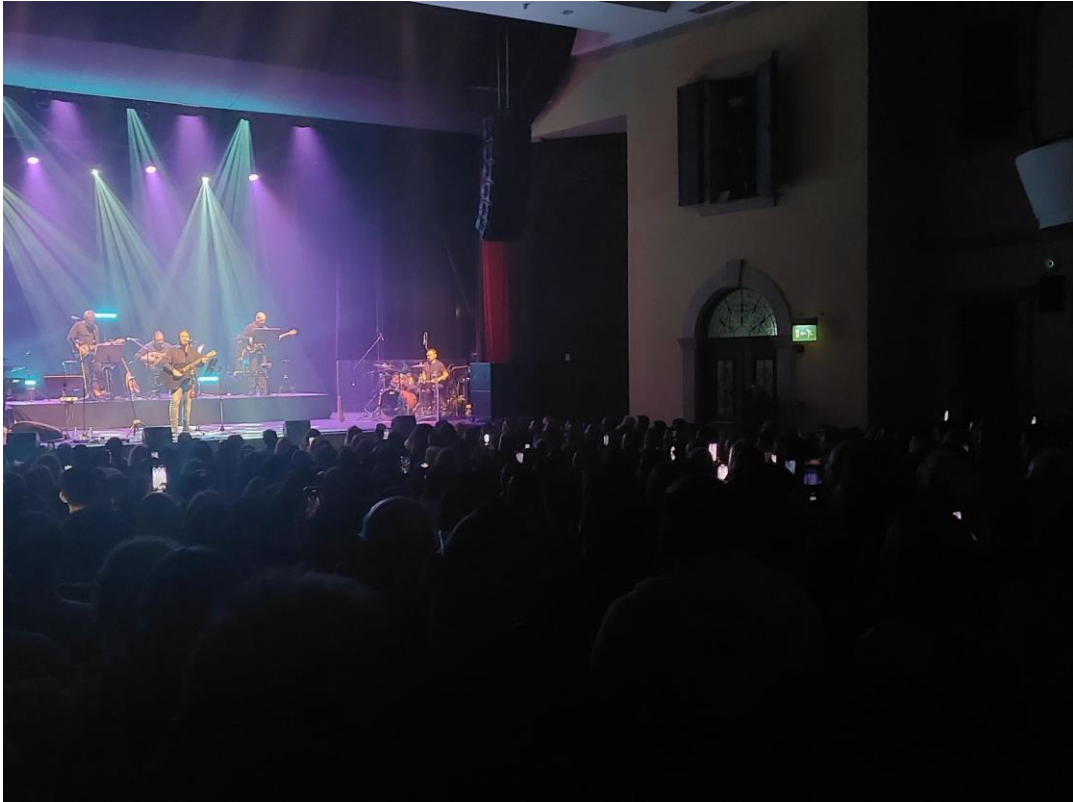
Εικόνα 6: Στιγμιότυπο από την συναυλία Γιάννη Κότσιρα στις 24 Φεβρουαρίου στο Θέατρο Ριάλτο. Χρήση κινητού τηλεφώνου μετά την παρατήρηση της παραγωγής προς στο θέατρο.