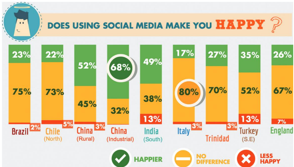
Εικόνα 3: Κατανομή των απαντήσεων στην ερώτηση σχετικά με το αν τα μέσα κοινωνικής δικτύωσης έκαναν τους χρήστες πιο ευτυχισμένους

Συνεπώς, όλα τα αποτελέσματα τα οποία εμφανίζονται στην πιο πάνω βιβλιογραφική επισκόπηση έχουν μια κοινή πορεία καθώς τα αποτελέσματα τους προέρχονται από ένα και μόνο σκοπό, την καταγραφή οπτικοακουστικού υλικού. Από την έρευνα των Lowe & Grieve (2018) συνοψίζεται ότι οι χρήστες και οι χρήστριες όντως έχουν κάποιες σκέψεις οι οποίες οδηγούνται οργανικά προτού κοινοποιήσουν υλικό στα ΜΚΔ. Ο κάθε χρήστης και η κάθε χρήστρια θα αναρωτηθεί όλους τους παράγοντες που παρουσιάζονται μέχρι να καταλήξει στον διαμοιρασμό. Ενώ η έρευνα των Lowe & Grieve (2018) δεν προηγείται της έρευνας των Miller et.al (2016) μπορεί να δικαιολογήσει εν μέρει τους τρόπους με τους οποίους θα σκεφτούν οι χρήστες και οι χρήστριες τα κριτήρια ή τις ανησυχίες προτού ανεβάσουν κάτι στα ΜΚΔ και θα καταλήξουν να δημοσιεύσουν την φωτογραφία που τράβηξαν. Ακόμη, θα μπορούσε να δικαιολογήσει αν αυτές οι σκέψεις οδηγούν τα άτομα στο να επιλέγουν φωτογραφίες που θα κοινοποιήσουν με αυτά τα κριτήρια από την πληθώρα που καταγράφουν. Επίσης, το δεύτερο σκέλος της βιβλιογραφίας των Miller et.al. (2016) που παρουσιάζεται στην εικόνα 3 βοηθάει στο απαντηθούν κάποια καινούρια ερωτήματα τα οποία τέθηκαν για τους σκοπούς της παρούσας πτυχιακής εργασίας όπως η ικανοποίηση που προσφέρουν τα ΜΚΔ μετά από την ανάρτηση μιας φωτογραφίας. Εν κατακλείδι, τα αποτελέσματα των δύο ερευνών που παρουσιάστηκαν ενώ