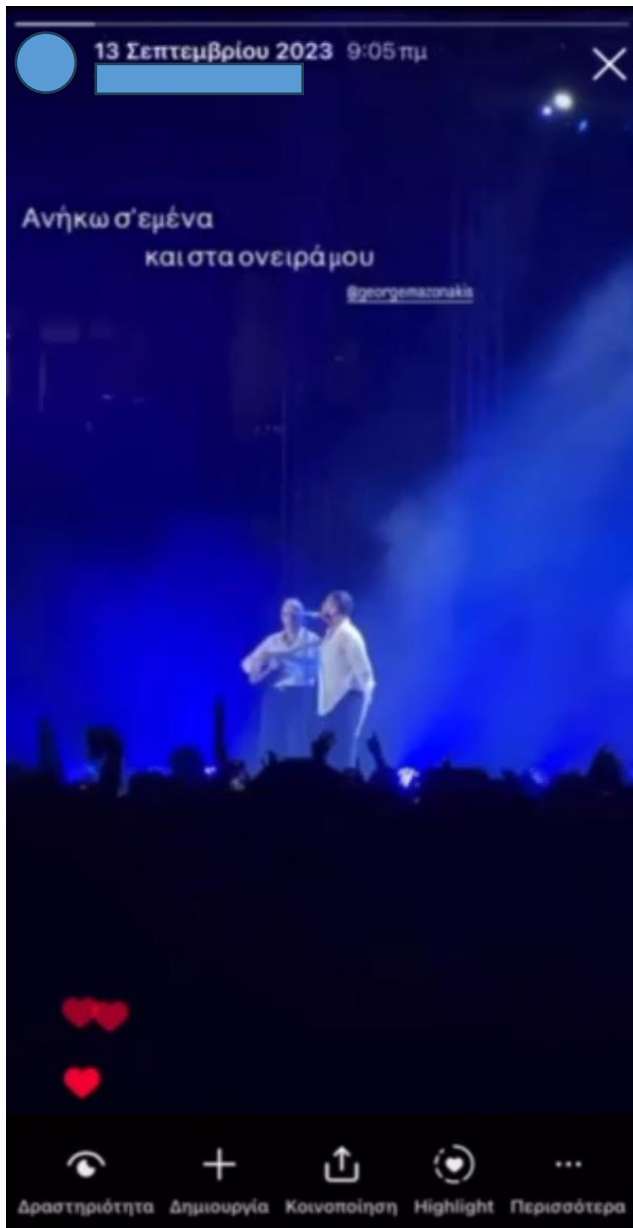
Εικόνα 9: Screenshot από Scroll Back Technique Video

της χρήστριας. Επίσης, τοποθετεί κάτω σε κεντρική στοίχιση την τοποθεσία στην οποία βρισκόταν όταν έκανε καταγραφή.