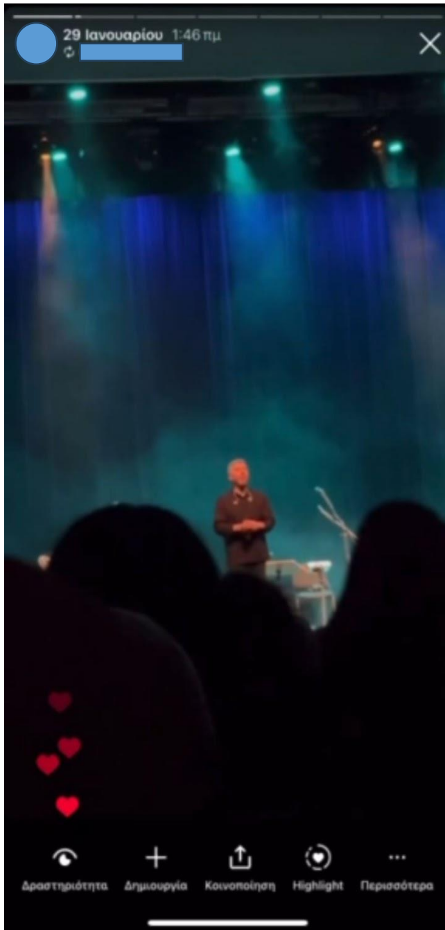
Εικόνα 13: Screenshot από Scroll Back Technique Video

αφορούσε αναδημοσίευση (repost) από μια φίλη του που ήταν μαζί. Συμπλήρωσε, ότι το συγκεκριμένο repost ήταν θολό παρ' ολ' αυτά μετά την ανάρτησή του το είχε αντιληφθεί. Έχει προστεθεί φίλτρο “Tokyo” από τα φίλτρα τα οποία παρέχει το Instagram με στόχο να βελτιώσει την ποιότητα του βίντεο. Επίσης, πρόσθεσε σε ετικέτα τον Dj τον οποίο παρουσιαζόταν στο βίντεο και το emoji 📌 θέλοντας να δώσει να καταλάβουν οι ακόλουθοι ότι πρόκειται για ένα κορυφαίο Dj.