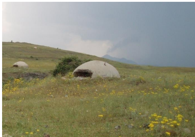
Πολυβολείο στην αλβανική πλευρά των συνόρων κοντά στην Κόνιτσα

είναι η δεξαμενή των φυσικών και ανθρώπινων πόρων του κράτους», αναπαριστώντας την κυριαρχία του. Μπορεί κανείς να πει ότι η παρατήρηση των Donnan και Wilson 8 πως τα σύνορα -νοούμενα εδώ ως χώρος- αποτελούν ένδειξη για τις ειρηνικές ή εχθρικές σχέσεις των δύο κρατών που τα χαράσσουν, επιβεβαιώνεται αν παρατηρήσει κανείς σήμερα τα ελληνοαλβανικά σύνορα. Από την μια τα «μπούνκερ», τα πολυβολεία στην αλβανική πλευρά, από την άλλη το «τείχος» των μνημείων αλλά και των «ιερών τόπων», όπως τα εικονοστάσια, αποτελούν μάρτυρες της σχέσης μεταξύ των δύο κρατών, τουλάχιστον σε μια δεδομένη περίοδο. Αποτελούν, επομένως, «ιστορικά και σύγχρονα αρχεία για τη σχέση ενός κράτους με άλλα» 9 .