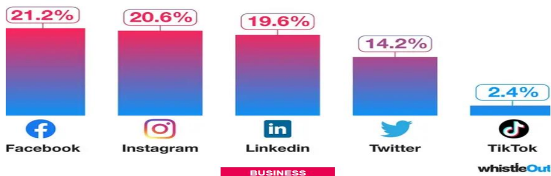
Εικόνα 4: Ποια ΜΚΔ προβάλλουν τις περισσότερες διαφημίσεις