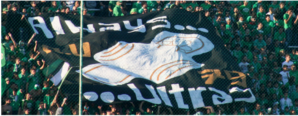
Φωτογραφικό Αρχείο Ερευνητικής Ομάδας

Ακόμα πιο ισχυρή είναι η υποτίμηση των αντιπάλων με βάση το στοιχείο της σεξουαλικής υπεροχής , όπου "Εμείς vs οι Άλλοι" = αυτοί που "γαμούν" vs αυτοί "δε γαμούν" ή ακόμα πιο εμφατικά "Εμείς vs οι Άλλοι" = αυτοί που "γαμούν" vs αυτοί που "γαμιούνται" (οι εντός εισαγωγικών όροι έχουν ασφαλώς εδώ το νόημα που τους προσδίδεται στο υπό μελέτη επικοινωνιακό πλαίσιο). Το στοιχείο αυτό είναι συνυφασμένο και με ένα άλλο, αυτό της σεξουαλικής προτίμησης , όπου "Εμείς vs οι Άλλοι" = ετεροφυλόφιλοι vs ομοφυλόφιλοι. Ένα από τα σημαντικότερα συμπεράσματα αυτής της έρευνας είναι ότι τα νοήματα αυτά δεν είναι καινοφανή ούτε εγγενή στα γήπεδα· η κυριαρχία αυτών των νοημάτων στο οπαδικό επικοινωνιακό τοπίο είναι αποτέλεσμα της απλοϊκότητας και της απουσίας επικοινωνιακής συστολής που χαρακτηρίζει αυτό το τοπίο και όχι αποτέλεσμα κοινωνικής διαφοροποίησης των οπαδικών ομάδων από την υπόλοιπη κοινωνία. Η προβαλλόμενη διαφορά μεταξύ "ενεργητικής" και "παθητικής" σεξουαλικότητας, στις πιο πάνω αντιθέσεις, κατοπτρίζει μια επικρατούσα στην ευρύτερη κυπριακή κοινωνία αντίληψη, σύμφωνα με την οποία το "ενεργητικό μέρος" επιβάλλεται με το σεξ, κερδίζοντας σε κύρος, ενώ το "παθητικό μέρος" υποτάσσεται και υποτιμάται. Παρατίθενται δύο παράδειγμα συνθημάτων από τον ίδιο ποδοσφαιρικό αγώνα που δείχνουν το συχνό φαινόμενο της προσπάθειας επικράτησης επί του αντιπάλου στη βάση του ποιος θα "γαμήσει" ποιον: "ΑΠΟΕΛ, ΑΠΟΕΛ, κάτσε πα' στο βίλλο της ΑΕΛ" και "Έλα ΑΕΛ, έλα ΑΕΛ, κάτσε πα' στο βίλλο του ΑΠΟΕΛ".